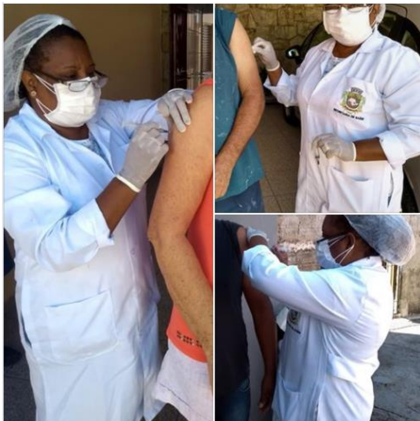
Vacinação dos Idosos contra a Influenza casa a casa.