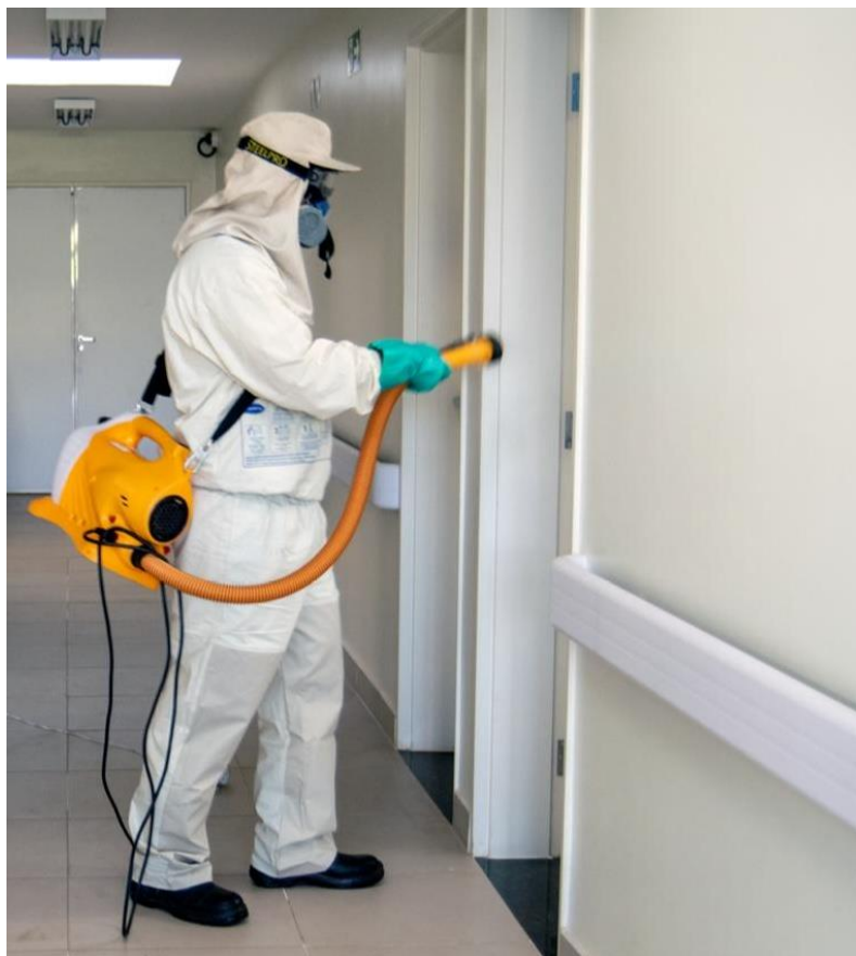
Desinfecção das Unidades Básicas de Saúde.