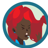
GOTÍCULAS DE SALIVA