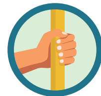
CONTATO COM SUPERFÍCIES CONTAMINADAS