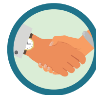
CONTATO FÍSICO COM PESSOA INFECTADA