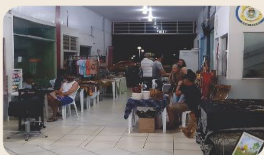
Exposição com artesãos locais

FEIRINHA DE ARTESANATO E PRAÇA DE ALIMENTAÇÃO