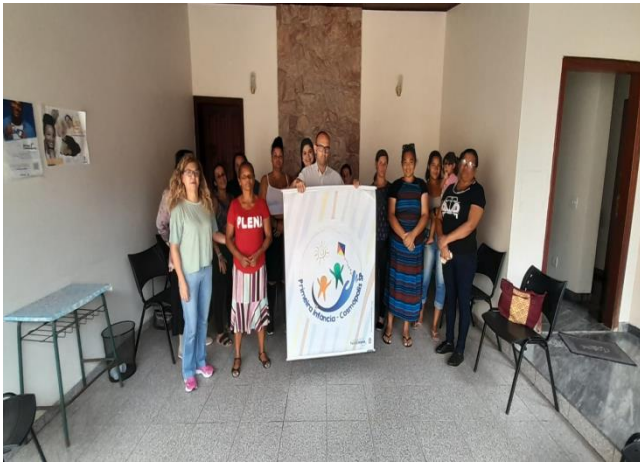
EMEB "Tutu Baloni"

Conversando com os pais - dia 07/08 - EMEB "Esther Nogueira", 11/08 - EMEB "Profª Alice de Campos Lapa", 14/08 - EMEB "Profª Isabel de Oliveira, 18/08 EMEB "Dona Jenny Rossi Roge", 21/08 - EMEB "Profª Maria Ap Toledo Strazzacappa", 25/08 - EMEB "Profª Roseli Ap. Toledo", 28/08 - EMEB "Profª Alairce C. Deangelo"