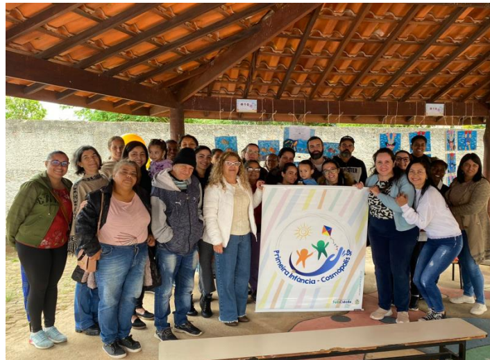
EMEB "Profª Alairce Ciani Deangelo"